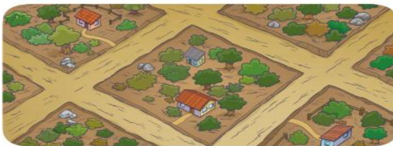
Bairro Veridiana em 1950.