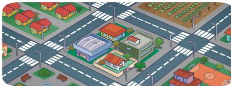
Bairro Veridiana em 2017.

A) Que elementos você consegue perceber que existiam em 1950 e permanecem até hoje?